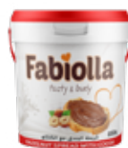
Cacao 350 - 850 g