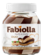
Cacao & lait en pot de 350 g

Fabiolla n'est pas seulement une marque, mais un choix de vie. Nos produits chocolatés à base de pâte à tartiner aux noisettes sont polyvalents, sains et pratiques, ce qui en fait un excellent choix pour les entreprises qui souhaitent élargir leur gamme de produits ou pour les familles à la recherche d'un en-cas délicieux et nutritif. Notre engagement en faveur de la qualité, associé à notre passion pour un goût exceptionnel, distingue Fabiolla des autres produits à base de chocolat à tartiner aux noisettes disponibles sur le marché.