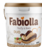
Cacao y Leche 350 – 850 g