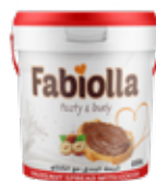
Cacao 350 – 850 g