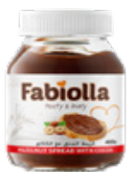
Cacao 400 – 750 g. Tarro