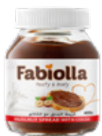
Cacao 400 - 750 g. Pot