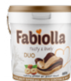
Cacao & lait 350 - 850 g